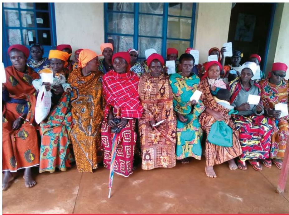
Femme en file d'attente pour le dépistage au CDS Muramba/Bururi; 2019