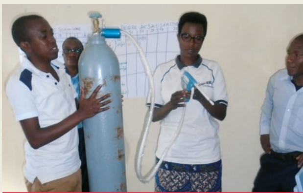
La formation des prestataires de soin à Rumonge, 2018