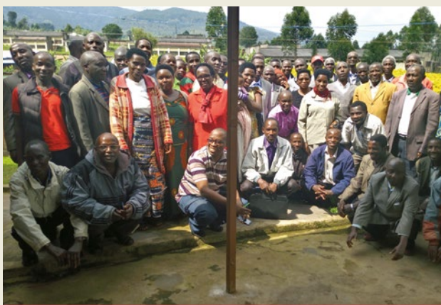
Prise pendant l'atelier de sensibilisation des leaders à Bururi, 2018

Ils contribuent à la mobilisation de la population pour la prévention du cancer du col à travers le dépistage précoce et traitement des lésions précancéreuses. Ils contribuent aussi à la lutte contre les rumeurs qui circulent dans la communauté.