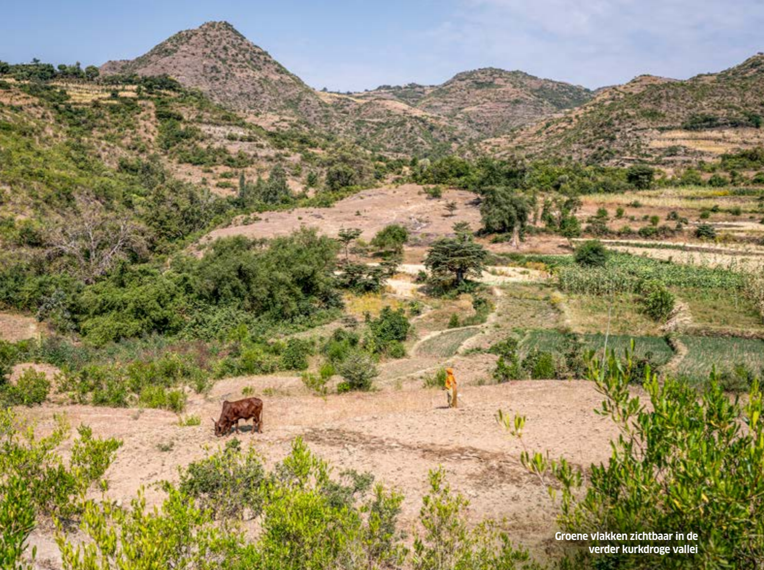
Groene vlakken zichtbaar in de verder kurkdroge vallei

was direct zichtbaar. Vanaf de omringende heuvels zijn nu in de verder kurkdroge vallei tientallen groene vlakken te zien. Inmiddels kunnen de boeren op deze akkers vaak meerdere keren per jaar oogsten.