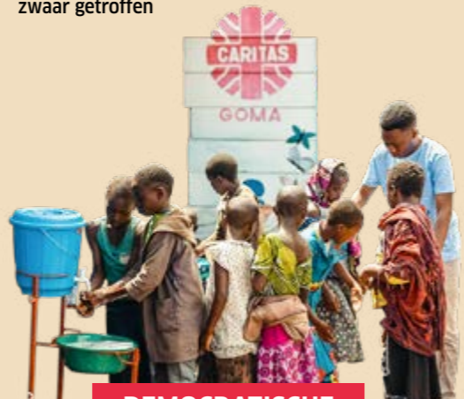
DEMOCRATISCHE REPUBLIEK CONGO